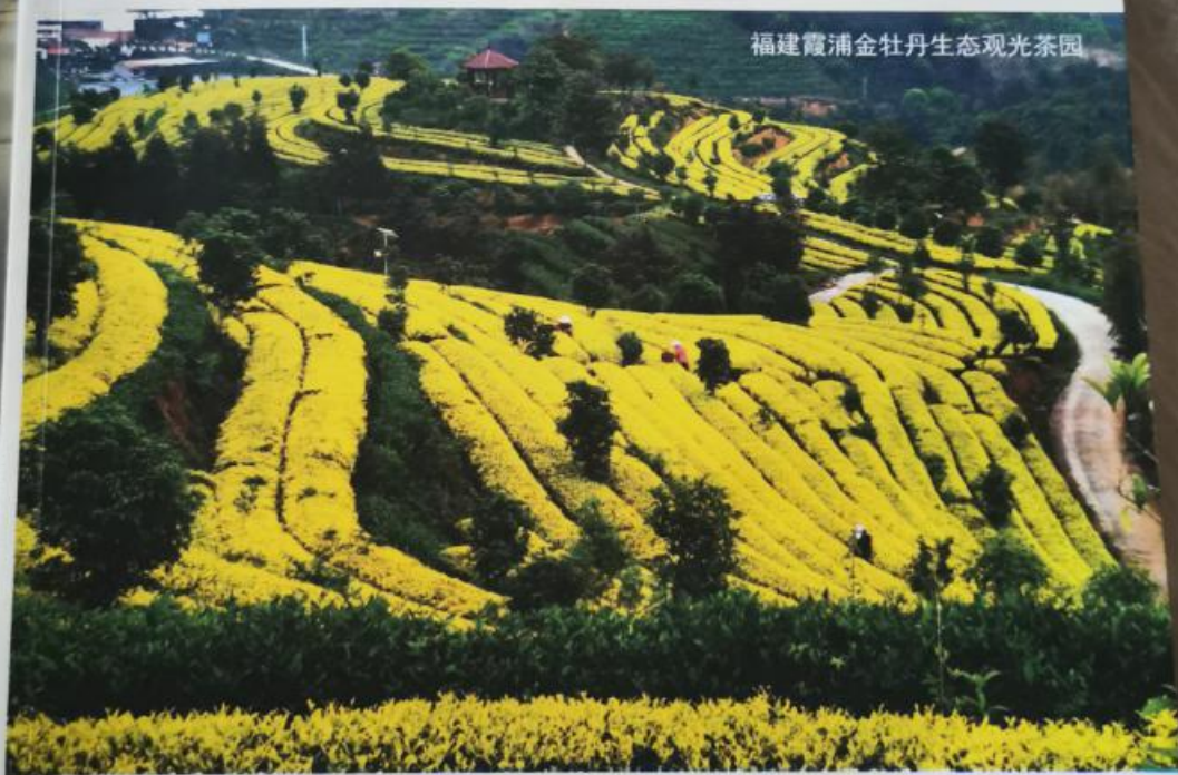
福建霞浦金牡丹生态观光茶园